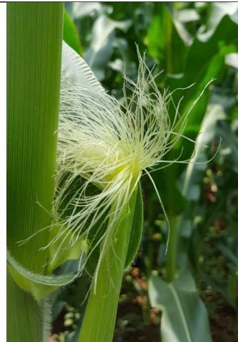
1- Không có hoặc rất nhạt