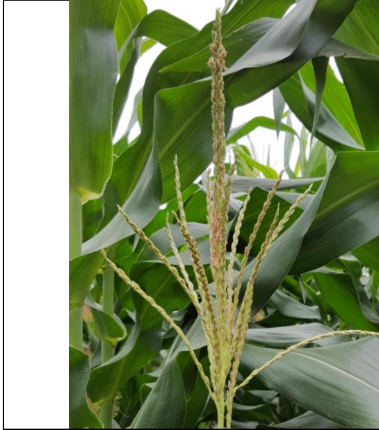
3- Hơi cong

TT 14- Cờ: Thể của nhánh bên (1/3 bông cờ ở phía dưới)